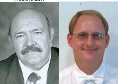
Ds At Mc Donald