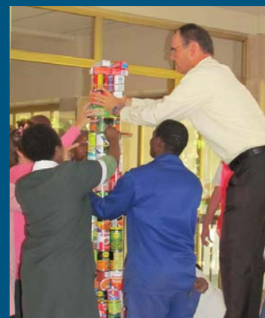
Die sinodale personeel bou saam