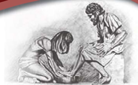
Toe Hy hulle voete klaar gewas het, sê Hy vir hulle: "Verstaan julle wat Ek vir julle gedoen het?" Uit Johannes 13: 12

www.nhk.co.za www.hervormer.co.za www.hervormer.co.za/e_Hervormer.html