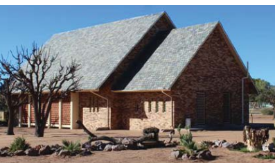
Gobabis se kerkgebou