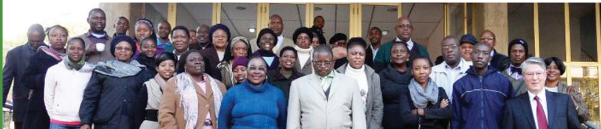
'n Deel van die groep kursusgangers by die Sinodale Kerkkantoor in Pretoria