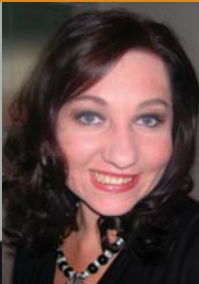
Prop Lisa-Mari Swanepoel