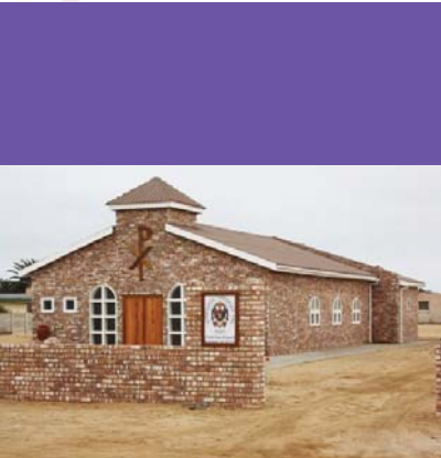
Hentiesbaai se nuwe kerkgebou