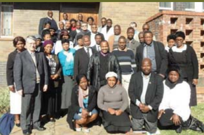
VTT in Durban