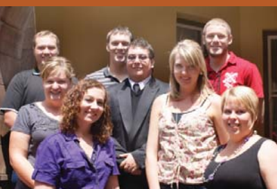
Die finalejaar teologiese studente