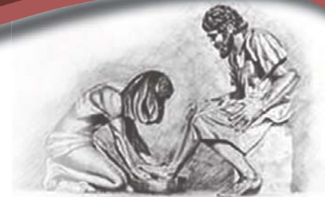
Toe Hy hulle voete klaar gewas het, sê Hy vir hulle: "Verstaan julle wat Ek vir julle gedoen het?" Uit Johannes 13: 12

Indien u nie weer die e-Hervormer wil ontvang nie, klik op www.hervormer.co.za/cancel.html