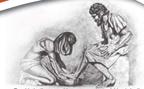
Toe Hy hulle voete klaar gewas het, sê Hy vir hulle: "Verstaan julle wat Ek vir julle gedoen het?" Uit Johannes 13: 12

www.nhk.co.za www.hervormer.co.za www.hervormer.co.za/e_Hervormer.html