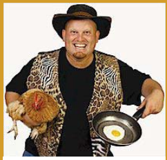
Thys die Bosveldklong